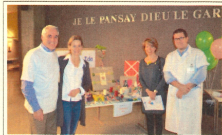
Journée internationale du cancer de l'enfant International Childhood Cancer Day