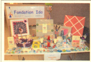
Présentation de Fondation Ida Presentation of Fondation Ida

"Fondation Ida travaille dans un esprit de solidarité avec les enfants malades et moins privilégiés dans le monde. Leurs ateliers créatifs aident à alléger leur vie douloureuse et difficile."