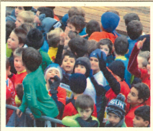
Course de l'Escalade à Genève 2015 The Escalade Race in Geneva, 2015