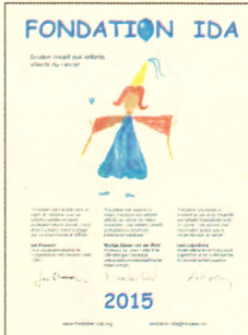
Calendrier 2015 Calendar 2015