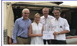
Contribution Kiwanis Club Rolle-Aubonne, 2017 Kiwanis Club Rolle-Aubonne Contribution, 2017