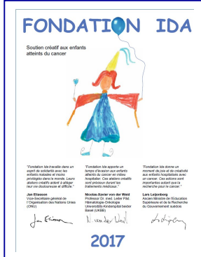
Calendrier 2017 Calendar 2017