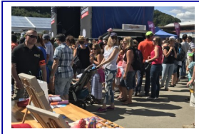
Venoge Festival soutient Fondation Ida, 2017 Venoge Festival supports Fondation Ida, 2017