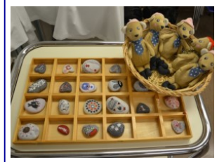
Porte-bonheur Lucky Charm

"Fondation Ida travaille dans un esprit de solidarité avec les enfants malades et moins privilégiés dans le monde. Leurs ateliers créatifs aident à alléger leur vie douloureuse et difficile."