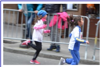
Course de l'Escalade à Genève, 2017 The Escalade Race in Geneva, 2017