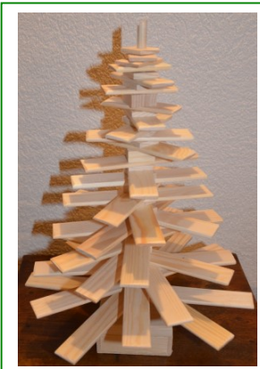
Arbre de Noël, Atelier de la Roulotte, 2018 Christmas Tree, Atelier de la Roulotte, 2018