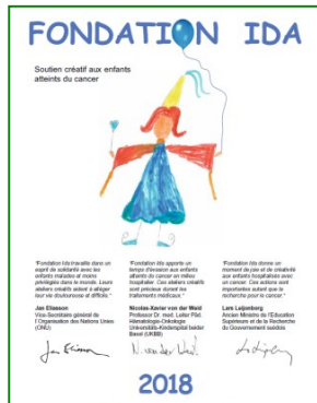
Calendrier 2018 Calendar 2018