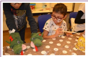
Distribution peluches IKEA Cuddly toys distribution IKEA