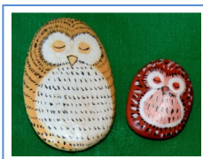
Porte-bonheur Lucky Charm

„Fondation Ida apporte un temps d'évasion aux enfants atteints du cancer en milieu hospitalier. Ces ateliers créatifs sont précieux durant les traitements médicaux.“