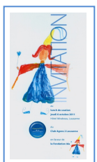
Club Agora, 2011 Club Agora, 2011