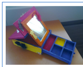
Boîte à bijoux