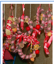
Marché de Noël, 2011 Christmas Market, 2011