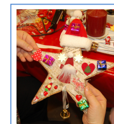
Étoile de Noël