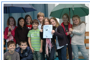
„Je m'informe“, 2011 „Je m'informe 2011