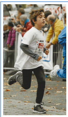
L'Escalade 2011 Escalade 2011