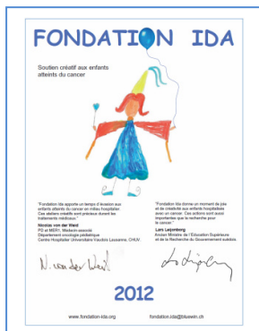
Calendrier 2012 Calendar 2012