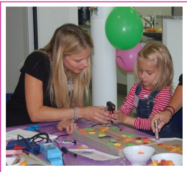
Atelier Solidarité, 2010 Solidarity Workshop, 2010