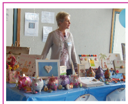
Lion's Club, 2010 Lion's Club, 2010