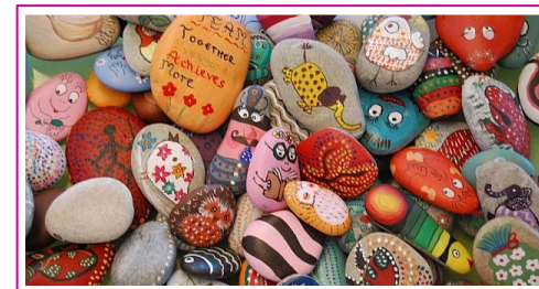
Porte-Bonheur, Lucky Charm