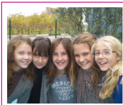
Vente pâtisseries, 2010 Bake Sale, 2010