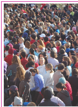
L'Escalade 2010 L'Escalade 2010