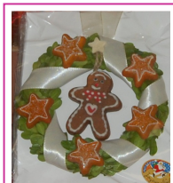
Marché de Noël, 2010 Christmas Market, 2010