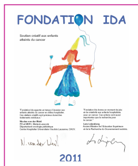
Calendrier 2011 Calendar 2011